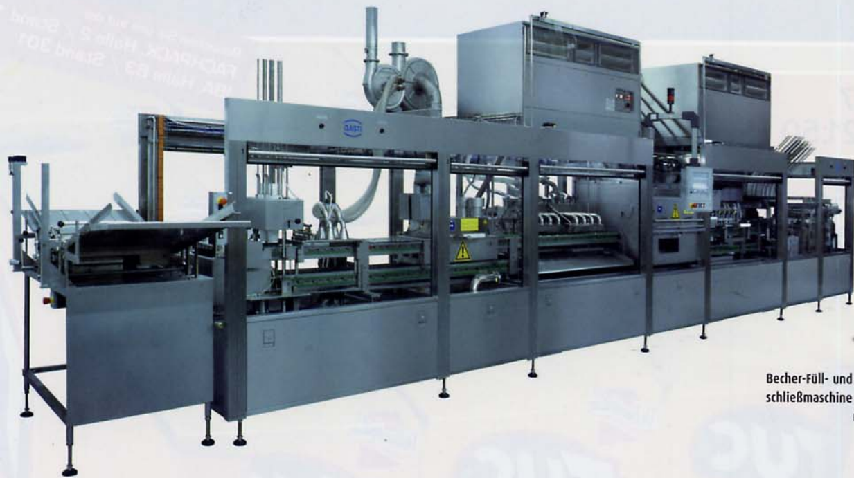
Becher-Füll- und Verschlussmaschine CS 81.