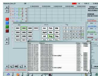
Datums- oder störungsspezifische Kurvenauswahl

Die Richtlinie des Erhitzerausschusses vom August 1998 zu ‚Mess-, Regel-, Kontroll- und Sicherheitseinrichtungen für die Milcherhitzungsanlagen‘ be- schreibt die näheren Anforderungen an eine Registrierungseinrichtung, die