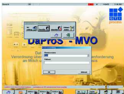
Anmeldung an das System und Erhitzerauswahl

Die eigentliche Befähigung zur Auf- zeichnung der Erhitzerkurven wird über eine spezielle Software herge- stellt. Diese setzt auf dem standardi- sierten und industrietauglichen Be-