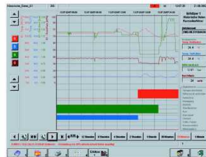
Detaildarstellung eines Erhitzerfehlers

Die Benutzeroberfläche ist für eine einfache Bedienung per Maus oder Touchscreen vorgesehen und orientiert sich an den typischen Windows-Stan- dards. Aus Sicherheitsgründen ist der Zugriff auf die Windows-Oberfläche bzw. das Betriebssystem verriegelt, da- mit die Betriebssicherheit des Systems nicht gefährdet werden kann. Über ein Auswahlmü können die aktuellen Aufzeichnungen aller Erhit- zer dargestellt werden. Dabei besteht die Möglichkeit einen beliebigen Aus- schnitt detailliert herauszuzoomen und mit allen Feinheiten darzustellen. Per Drucker können die Kurvendar- stellungen großformatig ausgedruckt wer- den.