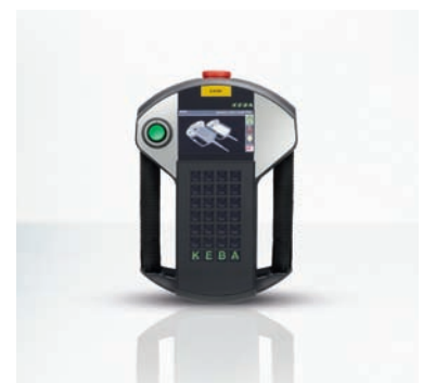
KeTop T20 techno